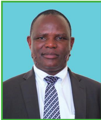
MHE. JAPHET NGAILONGA HASUNGA (MB.) Waziri wa Kilimo