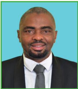
MHE. OMARY TEBWETA MGUMBA (MB.) Naibu Waziri Kilimo