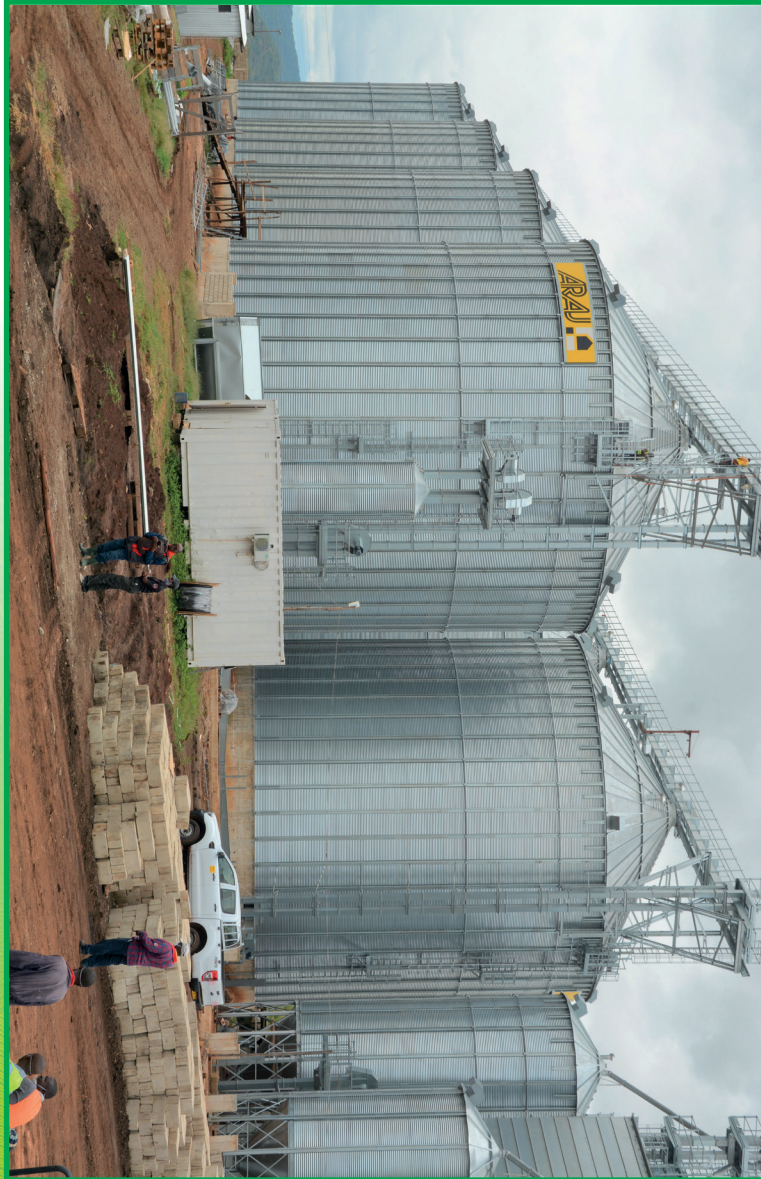
Vihenge vya kisasa vyenye uwezo wa kuhifadhi tani 40,000 za mazao vihujyongwa mkoa wa Manyara

KIMEPIGWACHAPA NA MPIGACHAPA MKUU WA SERIKALI, DODOMA - TANZANIA