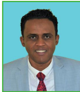
MHE. HUSSEIN MOHAMED BASHE (MB.) Naibu Waziri Kilimo