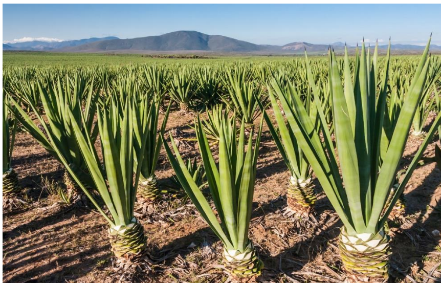
Eneo la kilimo cha mkonge limeongezeka

133. Mheshimiwa Spika , Bodi imeendelea kuongeza maeneo ya uzalishaji wa mkonge ambapo kufikia Machi 2019, hekta 5,529.50 zimepandwa mkonge mpya. Aidha, Bodi imesajili jumla ya wakulima wadogo wa mkonge 2,365 na wakulima wakubwa 22 sawa na asilimia 30.9 kwa wakulima wadogo na asilimia 100 kwa wakubwa. Vilevile, sekta ya mkonge imetoa ajira 129,022 kupitia mashamba na viwanda vya mkonge.