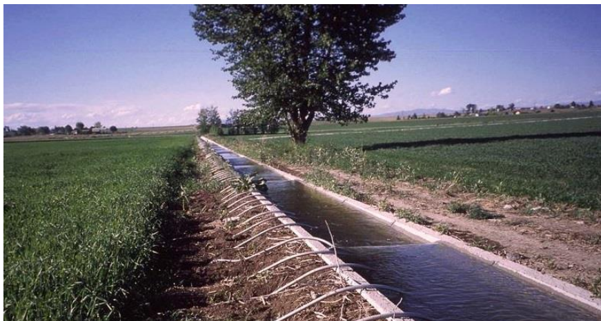
Miundombinu ya umwagiliaji imeendelea kukarabatiwa.

zimefikia wastani wa asilimia 78. Pia, ukarabati wa skimu 5 za mradi wa ERPP umefikia asilimia 51.